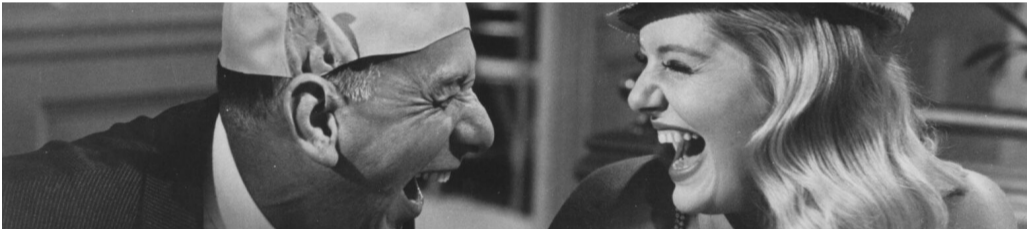
Ship of Fools

Renoirs Meisterstück lässt die Belle Epoque und das Moulin Rouge erstrahlen, feiert die Ausstattung und erfreut uns mit einem Wiedersehen mit Jean Gabin.