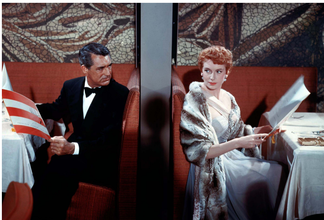
An Affair to Remember