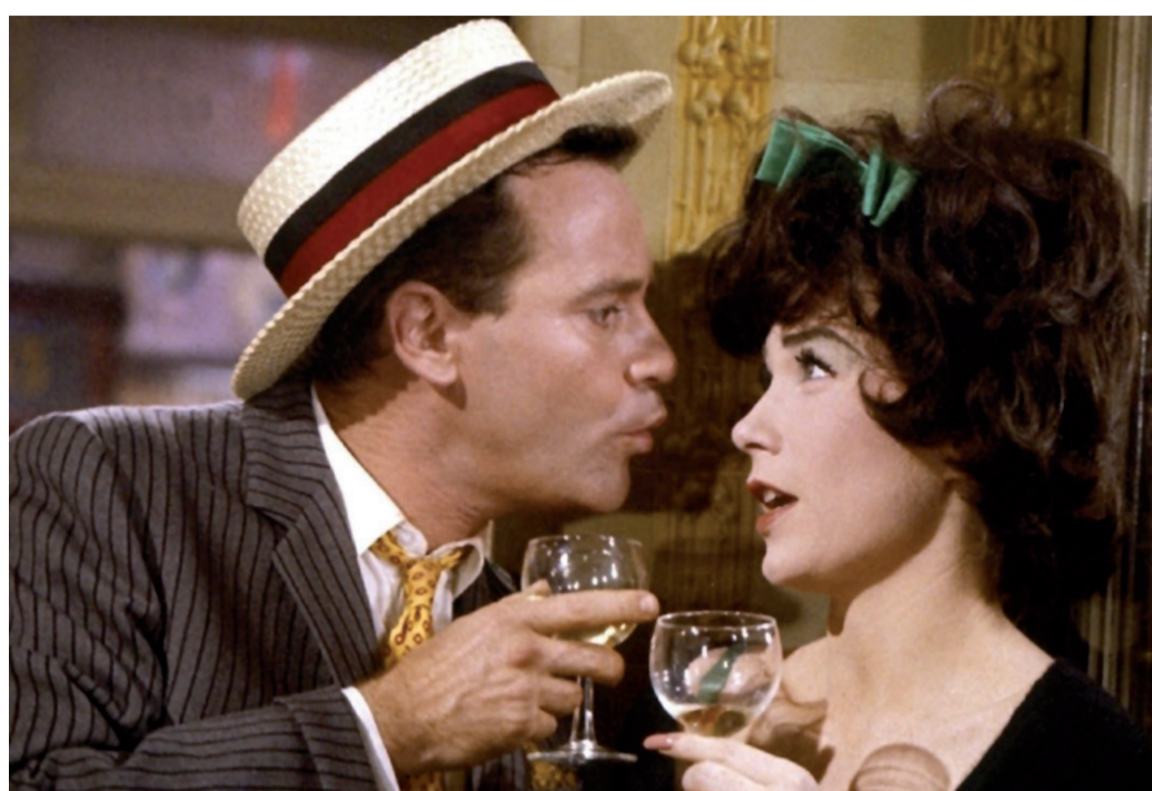
Irma la douce