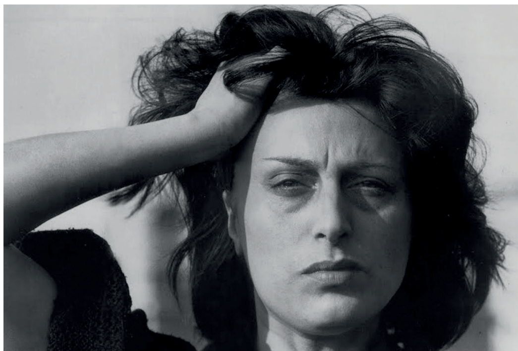
Roma, città aperta